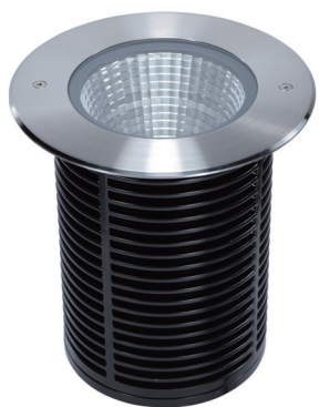
EXXLR Collerette Ronde Inox 316