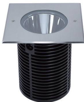
EXXLC Collerette Carrée Inox 316