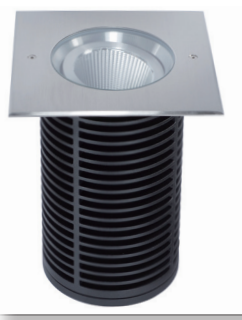
Réf 230V AC